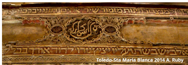
Toledo-Sta María Blanca 2014 A. Ruby