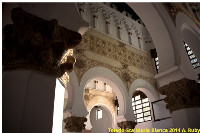
Toledo-Sta María Blanca 2014

las que tan orgullosos nos sentimos jamás hubieran sucedido, y la Historia de Occidente que hoy estudiamos sería otra. La Escuela de Traductores de Toledo no hubiera sido posible, ni Alfonso X tan sabio, ni la recuperación renovada y enriquecida de Aristóteles con las consecuencias que ello trajo para la ciencia y el pensamiento europeo de la mano de Santo Tomás y de la Escolástica nunca hubieran tenido lugar y, sin duda, nuestros místicos y sus obras tampoco.