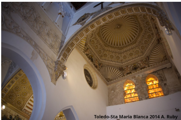
Toledo-Sta Maria Blanca 2014

Cuando nos adentramos en Santa María la Blanca o en la gran sala de oración de la Sinagoga del Tránsito bañadas por una cálida luz dorada de una tarde de diciembre, una emoción difícil de describir nos recuerda la riqueza y diversidad de nuestro pasado medieval, de Toledo, y por supuesto de Sefarad. Cuántas cosas podrían contarnos sus muros si pudieran hablarnos. El Tránsito todavía muestra, orgullosa de su pasado, textos en hebreo y árabe presididos por el escudo del rey de Castilla Pedro I, recordado y ensalzado en las inscripciones del propio edificio.