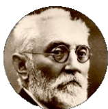
Miguel de Unamuno

https://www.biografiasyvidas.com/biografia/u/unamuno.htm