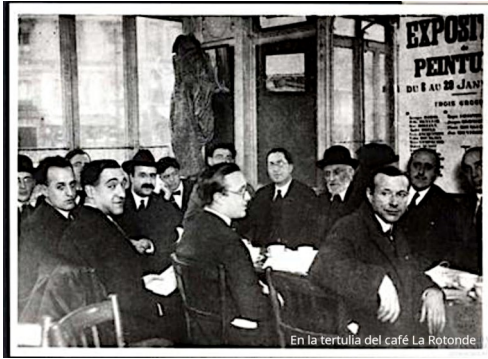
En la tertulia del café La Rotonde.

Caso de fallecer en Francia, Unamuno escribe: “Envolvedme en un lienzo de blancura/ hecho del lino del que riega el Duero/ y al sol de Gredos luego se depura/ -soy villano de a pie, no caballero-;/ no ese roto harapo gualdo y rojo/ -bilis y sangre- que enjuga a la espada”.