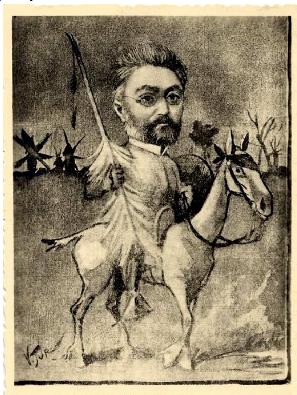
Miguel de Unamuno montado a Rocinante y portando una pluma de ave como lanza.

Y ya, a pesar de los Hunos y los Hotros (NOTA 1) , descansa en el nicho 340 del cementerio San Carlos Borromeo de Salamanca.