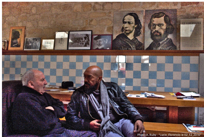
En diciembre de 2016, presenté Florencio a Lucio (Florencio o "Botas Verdes", venezolano y amigo del CaféHablante). Con Florencio tuve la idea de crear el CaféHablante

El legendario anarquista español Lucio Urtubia nació en Cascante, España, el 18 de febrero de 1931 y falleció en París, Francia, el 18 de julio de 2020.